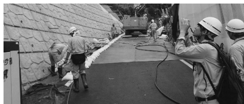
写真-2 現場での勉強会での風景

各技術者が持つ知識や経験を自身の「暗黙知」ととめると、他の技術者が将来直面する災害対応に活かさないこととなります。個人が現場で得た暗黙知を組織の形式知に展開するため、当支店では定期的に現場での勉強会を行い、それぞれの経験をもとに議論・共有することで、組織としての知見を深めるべく努力しています。