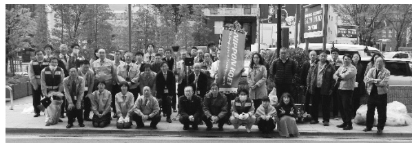
写真-3 大阪マラソンのクリーンアップ活動

近畿地方では、豪雨災害が頻発傾向にあることに加え、近い将来発生が懸念される南海トラフ地震など、今後も様々な災害に見舞われる可能性があります。これからもそれぞれの現場で、地域とのつながりを重視しつつ、地域の安全・安心に貢献できるよう、取り組んで参ります。