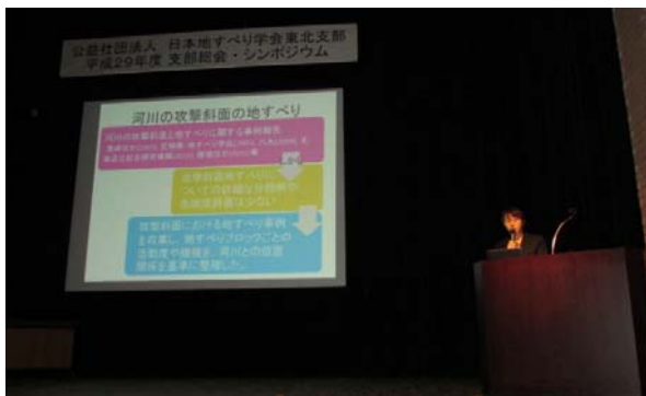
【高堂氏による講演】