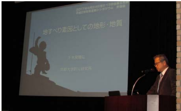
【千木良先生の基調講演】