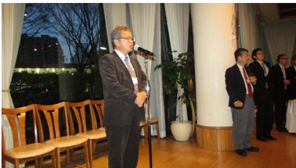
【千木良先生の挨拶】