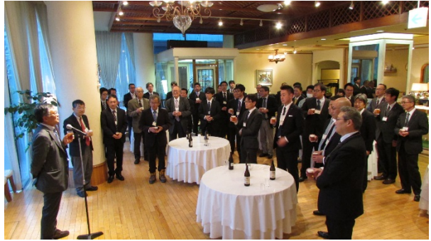
【宮城先生による乾杯】