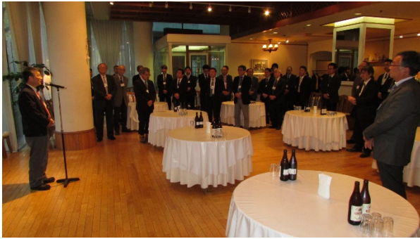
【八木支部長の挨拶】