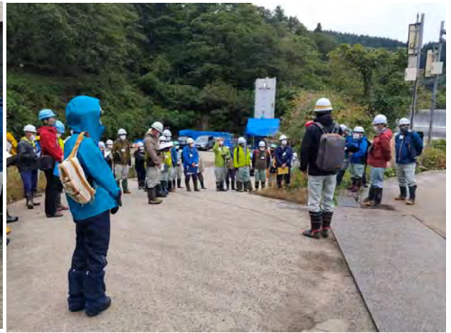
最上総合支庁河川砂防課 東海林様による事業概要説明