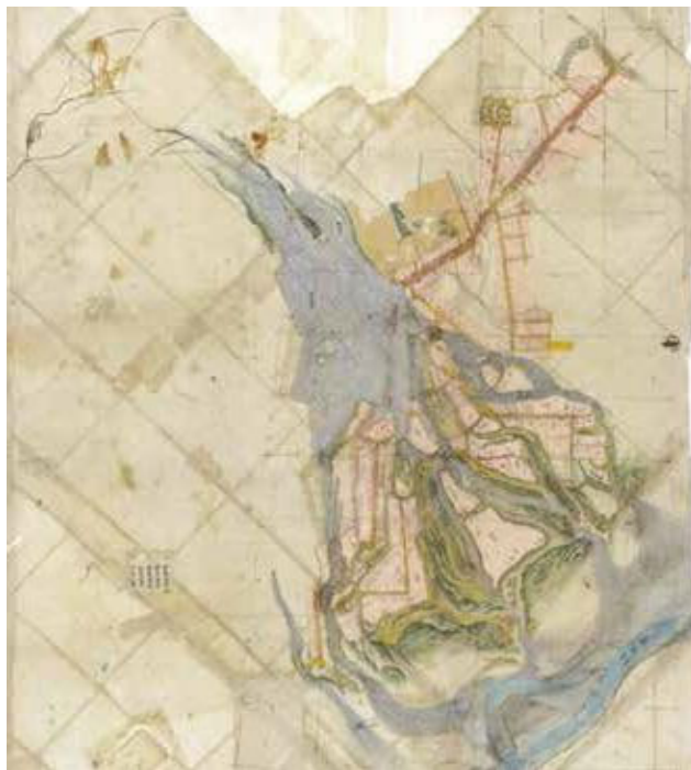
出典:寛保2 成年小諸洪水変地図(小諸市小山家所蔵) 1C-001001-601