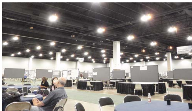
新技术紹介セッションとポスターセッション会場の様子（海外の学会）