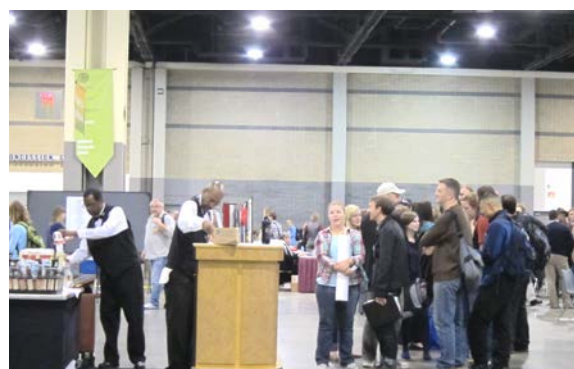
新技术紹介セッションとポスターセッションの会場での意見交換会の様子（海外の学会）