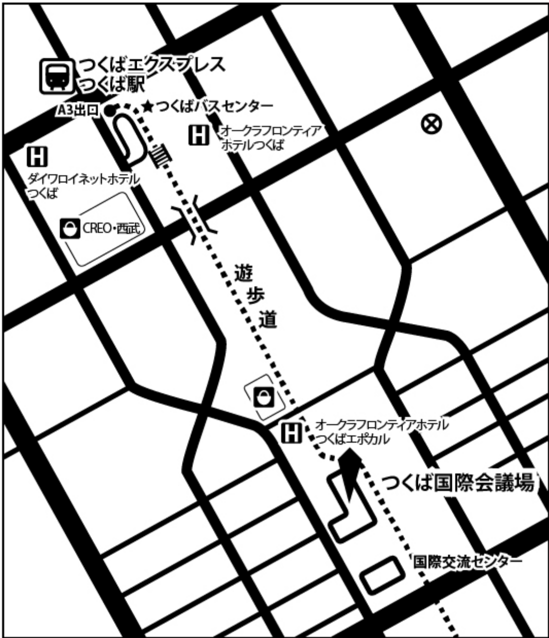
図-2 つくば国際会議場周辺マップ