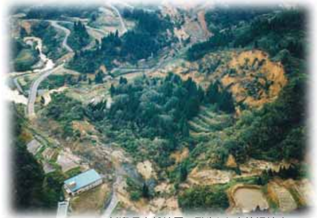
新潟県中越地震で発生した東竹沢地すべり

昭和12年、新潟県直江津(現・上越市)生まれ。國學院大学大学院修士課程(日本史学専攻)を修了。新潟県文化財保護連盟理事、上越郷土研究会会長などを務める。「直江兼続 史跡探訪」(新潟日報事業社)など著書多数。