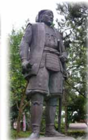
直江兼続像(長岡市)