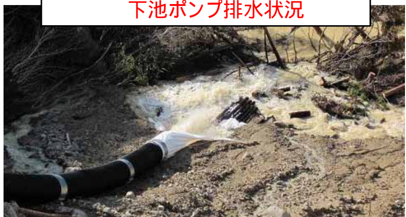
下池ポンプ排水状況