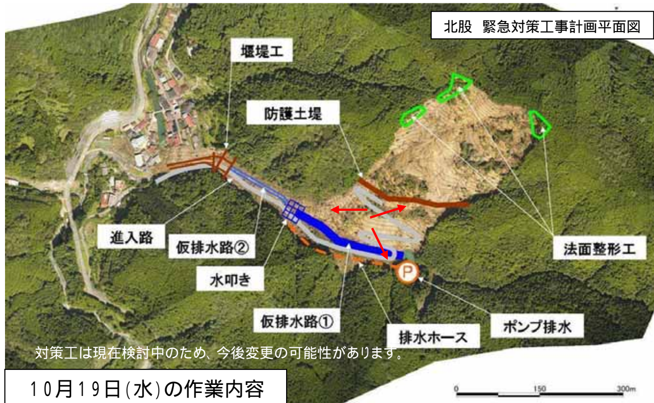
北股 緊急対策工事計画平面図