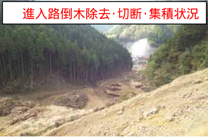
進入路倒木除去・切断・集積状況