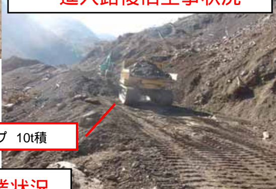
クローラダンプ 10t積