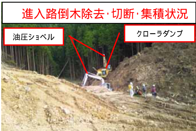
進入路倒木除去・切断・集積状況