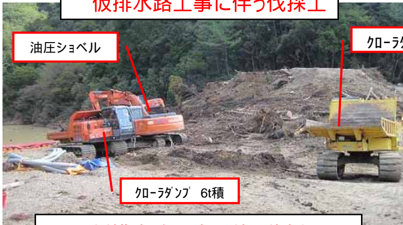
仮排水路工事に伴う伐採工