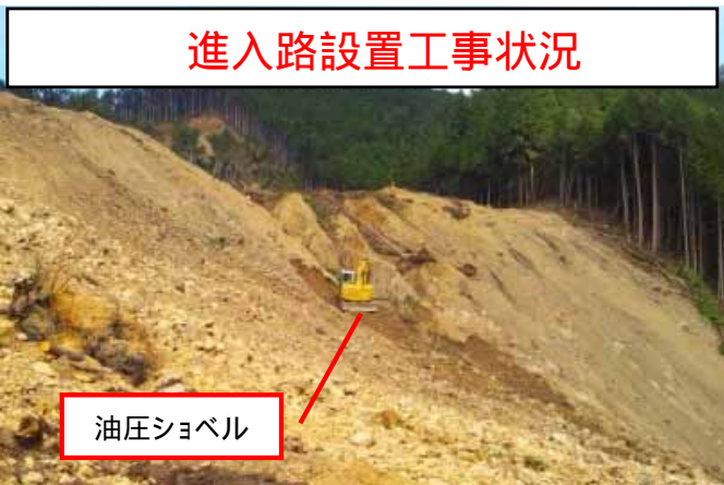
進入路設置工事状況