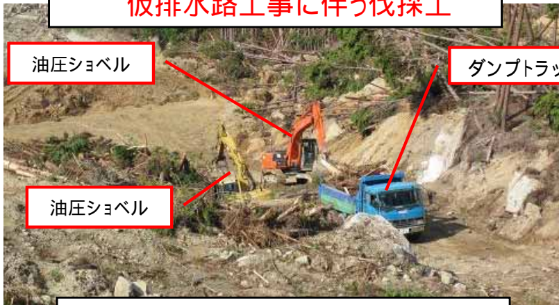
仮排水路工事に伴う伐採工