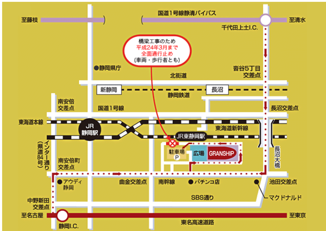
静岡県コンベンションアーツセンター グランシップ